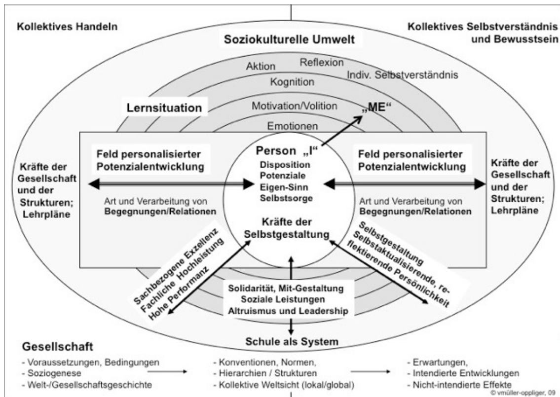
Abb.2 Ökologische Begabungsmodell (Müller-Oppliger, V., 2014)

Die Person steht im Zentrum mit ihren Potenzialen, Dispositionen und Personenmerkmalen; umgeben von ihrem soziokulturellen Umfeld mit dessen Erwartungen, Werten und Einstellungen. Beide, die Personenmerkmale wie auch das Umfeld können in der Interaktion hemmend oder fördernd wirken. Ökologisch ist das Modell einerseits mit Bezug auf die Systemtheorie der Persönlichkeitsentwicklung nach Bronfenbrenner (1981), andererseits, weil es nachhaltig das lebenslange Lernen unterstützt und steuert. Vorhandene Potenziale werden (an)erkannt und sollen weiter entwickelt und optimal gefördert werden.